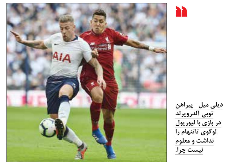
دیلی میل - پیراهن تویی اندروبرلد در بازی با لیورپول لوگوی تاتنهام را نشان داد و معلوم شد که تاتنهام را نیست چرا.