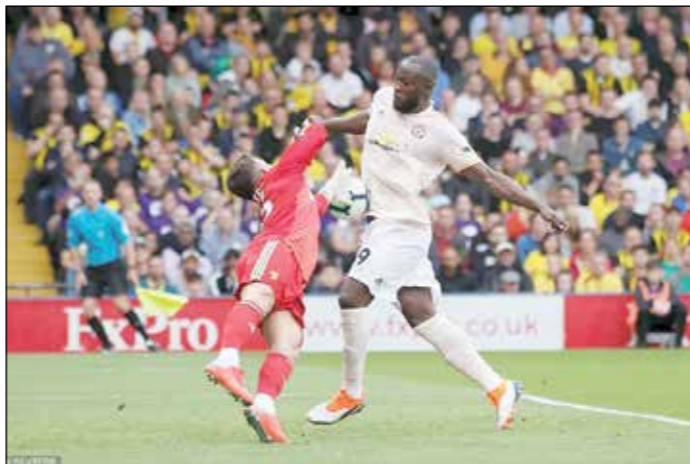
کریس ووکس Kris Woakes

تشویق طولانی تماشاگران منچستر یونایتد از سوی ژوزه مورینیو بعد از باخت خانگی ۳ بر صفر مقابل تاتنهام آن موقع تسلی بخش به نظر می‌رسید اما آن همدلی به تیم کمک کرد تا فرم ضعیف ابتدای فصل خود را جبران کند و حالا بعد از پیروزی ۲ بر یک برابر واتفورد چهره‌های بسیاری از آن هواداران با لبخند همراه است. دو گل در نیمه اول، مورینیو، دستیارانش و همه بازیکنان یونایتد را مثل همه هواداران یونایتد که برای این بازی خود را رسانده بودند، سرخوش کرد تا حال و هوایی کاملاً متفاوت نسبت به چند هفته اخیر بر تیم حکم شود. پیروزی در زمین برنلی قبل از تعطیلات بازی‌های ملی انتقاص مثبتی بود اما واتفورد هر چهار بازی قبلی خود را برده و تا قبل از مسابقات این هفته، بالای جدول با جلسی و لیورپول یکه تازی می‌کرد، آنها حتی همان اسپرزی که یونایتد را تحقیر کرد، شکست داده بودند. از سوت شروع، یونایتد تیمی فرمی به نظر می‌رسید که در مالکیت توپ و زمین برتر بود هرچند خطر زیادی