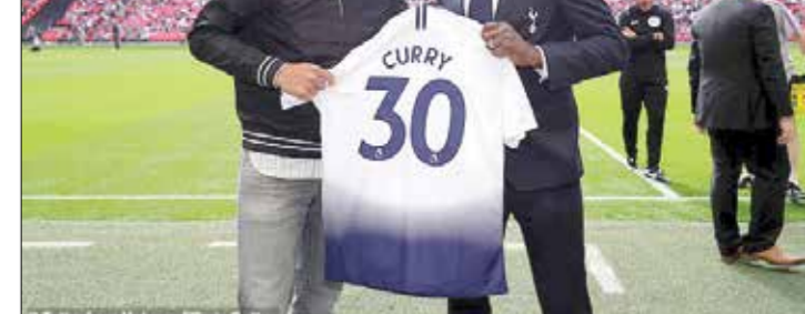
دیلی میل - استیفن کاری، ستاره بسکتبال آمریکا که برای تبلیغ NBA و همچنین برند خودش به لندن رفته، در ورزشگاه ویملی میهمان تاتنهام بود و یک پیراهن تاتنهام را از لئو کینگ، کاپیتان سابق و سفیر کنونی باشگاه هدیه گرفت.