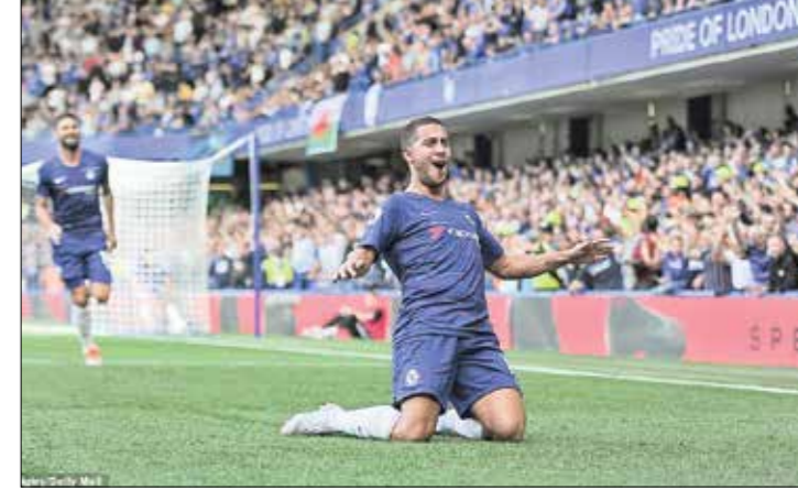
گل - ادن آزار با سه تریک برابر کاردیف، برای دومین بار برای جلسی هت‌تریک کرد. در تاریخ این باشگاه، تنها لیمار، دروگیا و هسلینگ و جسلا آزار توانسته‌اند در لیگ برتر بیش از یک بار هت‌تریک کنند.