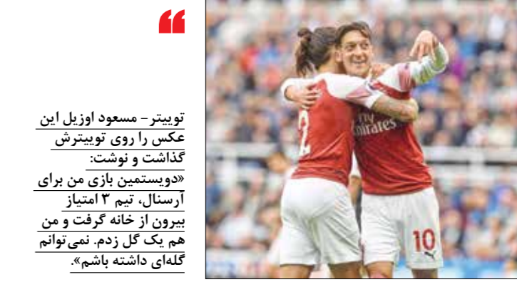
توییت - مسعود اوزیل این عکس را روی توئیترش گذاشت و نوشت: «دوستمین بازی من برای آرستال، تیم ۳ امتیاز بیرون از خانه گرفتم و من هم یک گل زدم. نمی‌توانم گلای داشته باشم.»