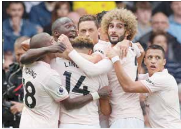
دیلی میل - منچستر یونایتد برابر واتفورد از پیراهن صورتی خود رونمایی کرد و در نهایت روند بدون باخت واتفورد را قطع کرد.

حالی که کلوپ و لیورپول از ماه اکتبر سال پیش وضعیت خوبی داشته‌اند، تاتنهام پسرقت کرده چون در جا زده است. کمبود مهره در این تیم حالا دارد مشهود می‌شود و این به دلیل عدم سرمایه‌گذاری برای تقویت تیم طی ۱۲ ماه گذشته و قبل از آن است. بازی‌سازی ورزشگاه وایت‌هارت لین بدون شک دارد روی قدرت مالی باشگاه لیورپول احساس سرزندگی بودن دارد و سرزنده هم هست اما تاتنهام دارد به تیمی متوقف شده و قابل پیش‌بینی تبدیل می‌شود. شاید این فقط آزمون و خطاهای ابتدای فصل باشد نه چیزی بیشتر اما این دو تیم از ماه اکتبر سال پیش در جهات متفاوتی قدم برداشته‌اند و لیورپول بدون شک آن تیمی بوده که در مسیر پیشرفت حرکت کرده است. لیورپول‌ها از وقت و پول‌شان استفاده‌های خردمندانه کرده‌اند اما این موضوع درباره تاتنهام صدق نمی‌کند. منبع: ESPN