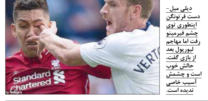
دیلی میل - دست فری توکنی اینظوری نوی چشم فریمینو رفت اما مهاجم لیورپول بعد از بازی خوب حالش بود و چشمش آسیب خاصی ندیده است.