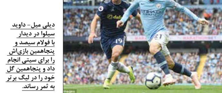
دیلی میل - داوید سیلوا در دیدار با فولام سیمد و پنجاهمین بازی‌اش را برای سیتی انجام داد و پنجاهمین گل خود را در لیگ برتر به ثمر رساند.

به بهانه پیروزی یونایتد برابر واتفورد سختکوش